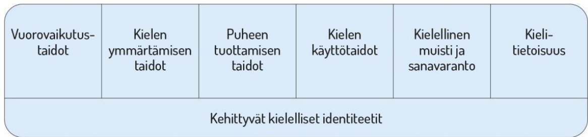
Kuvio 1. Lasten kielen kehityksen keskeiset osa-alueet esiopetuksessa