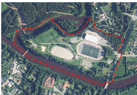
Kuva 1 Suunnittelualueen rajausta ortoilmakuvassa (ei mittakaavassa).

Suunnittelualue sijaitsee Muhoksen keskustan tuntumassa Muhosjoen pohjoispuolella. Suunnittelualue on kokonaisuudessaan Muhoksen kunnan omistuksessa. Asemakaavan koko on noin 15 hehtaaria.