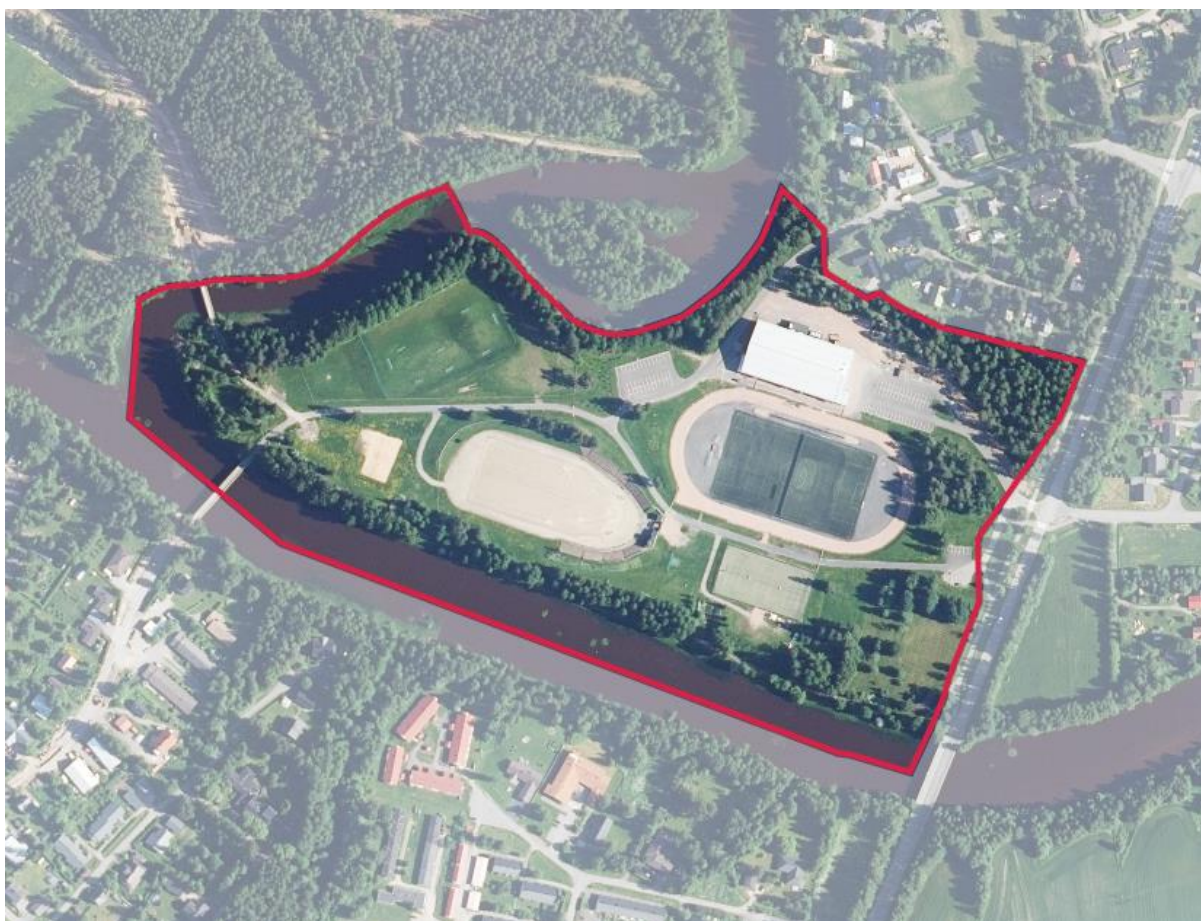
Kaava-alueen rajausta ortoilmakuvassa (ei mittakaavassa).

Asemakaavan muutos koskee Kirkonkylän asemakaavan korttelia 352 ja siihen liittyviä viher-, katu-, pysäköinti- ja vesialueita. Asemakaavalla muodostuvat korttelit 353 ja 354.