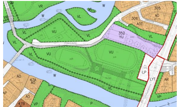
Kuva 4 Ote Muhoksen kunnan ajantasaisesta asemakaava yhdistelmästä.

Suunnittelualueella on voimassa oleva Kirkkosaari-Ponkila-asemakaava. Asemakaava on hyväksytty kunnanvaltuustossa 22.6.1998. Suunnittelualue on merkitty pääsääntöisesti urheilu- ja virkistyspalvelujen alueeksi (VU). Nykyisen jäähallin ympäristö on merkitty urheilua palvelevien rakennusten korttelialueeksi (YU). Alueen rannat ovat kaavassa lähivirkistysalueita. Ranta-alueilla on yksittäisiä luontotyyppiltään arvokkaita alueita (sl-1) ja lounaisnurkassa sijaitseva silta on kulttuurihistoriallisesti arvokas kohde (kaavamerkintä: sr-1).